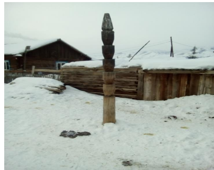
Коновязи жителей с. Курай