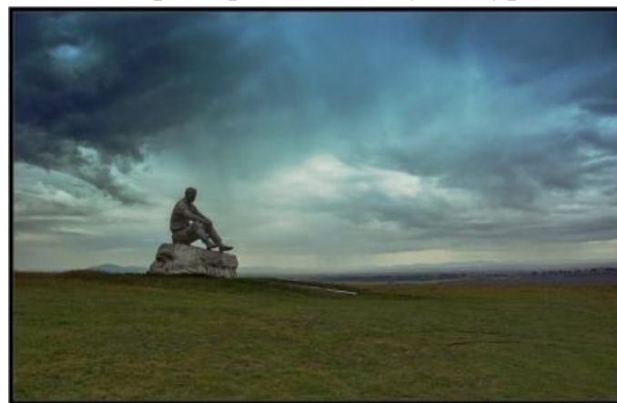
Памятник В.М. Шукшину на г. Пикет