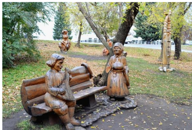
Парк деревянных скульптур