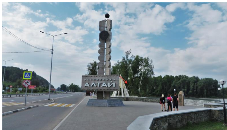
Въездной знак «Республика Алтай»