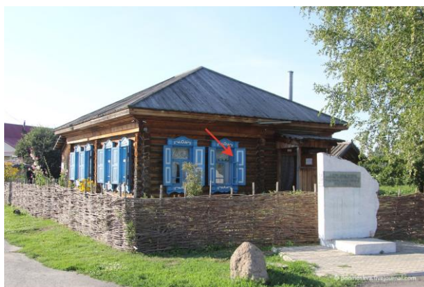
Дом-музей - В.М. Шукшина